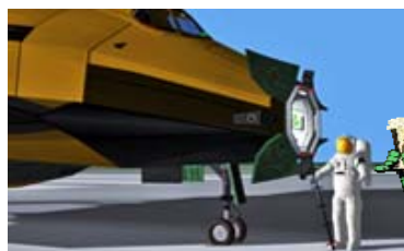
Échelle pour le DGIV