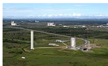
Textures "HiRes" Kourou-ELA