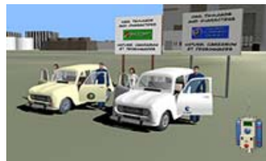
Spacecraft vs UCGO