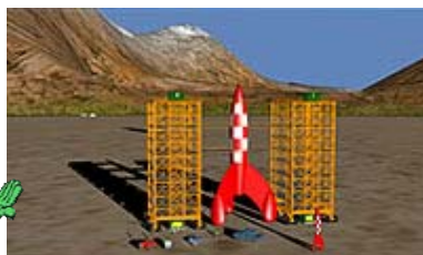
Tintin sur la Lune