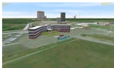
Kourou - CSG (part 1 & 2)