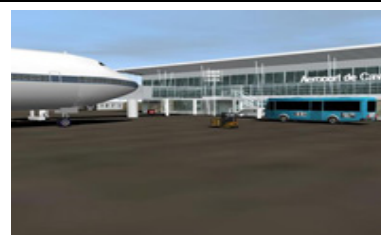
Aéroport de Cayenne-Rochambeau

de Papyref, Mustard et Jekka (les tuiles sont de moi)