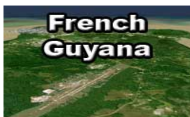
Textures Guyane française