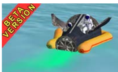
Amélioration pour Gemini