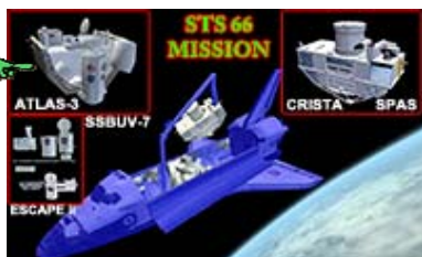
Ensemble Crista-Atlas ( STS66 mission)